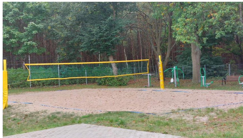
Boisko do siatkówki wraz z siłownią zewnętrzną