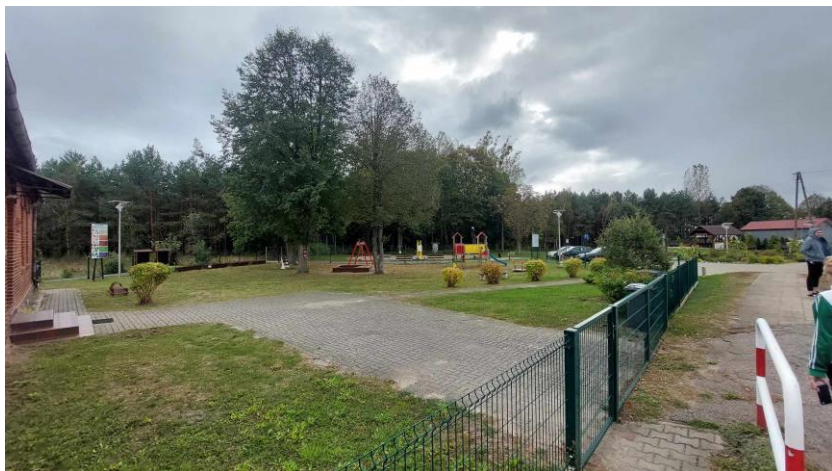
Teren rekreacyjny przy przedszkolu