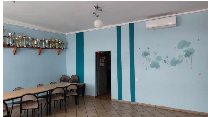
Wnętrze świetlicy wiejskiej w Kawczynie