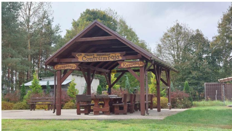
Wiata integracyjna pn. Centrumraja