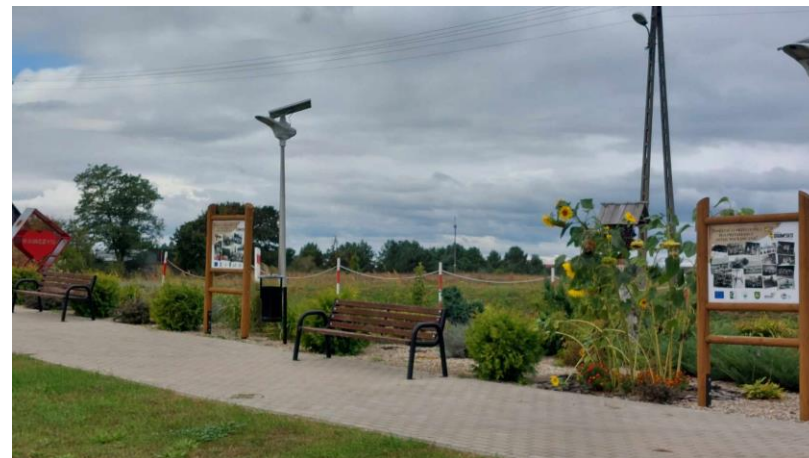
Skwer w centrum wsi wraz ze ścieżką edukacyjno-historyczną