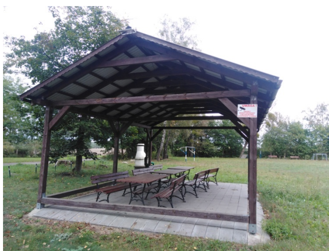
Altana na placu rekreacyjnym