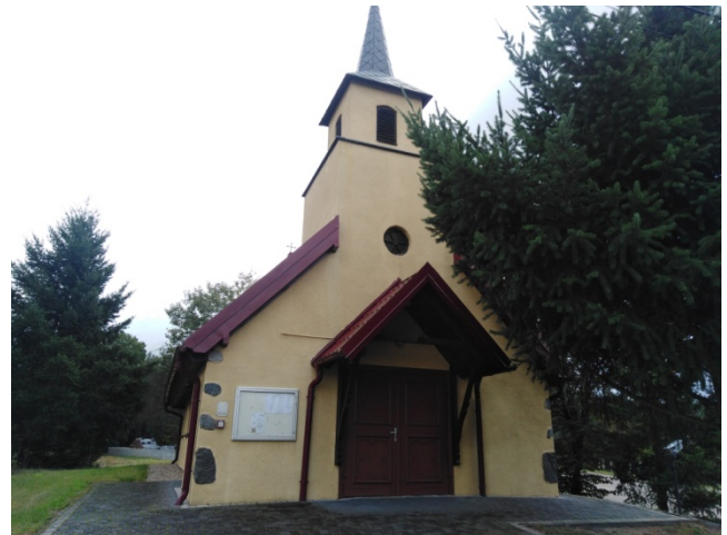
Kaplica pw. św. Piotra