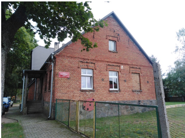
Gminne Przedszkole Publiczne