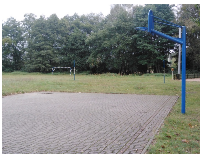
Boisko do koszykówki