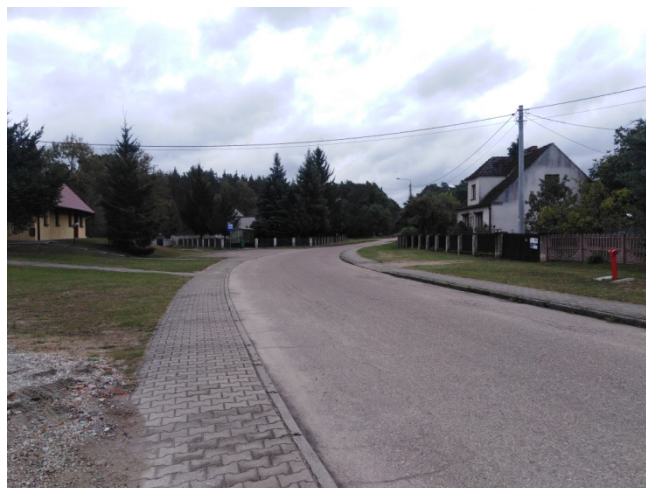
Droga wojewódzka przebiegająca przez centrum