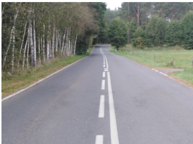
Droga wojewódzka prowadząca do miejscowości