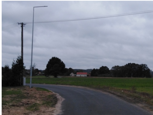
Droga gminna prowadząca do miejscowości i przebiegająca przez centrum