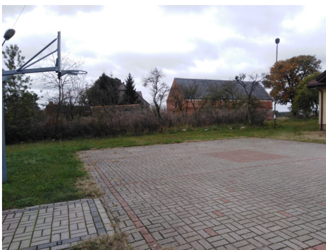
Altana i boisko na placu przy świetlicy